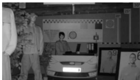
Immagine della telecamera a una forte luce diretta di fronte alla telecamera: