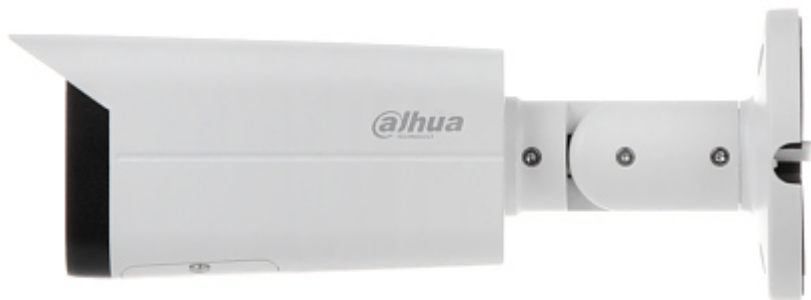
Slot per scheda di memoria: