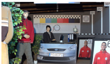
Immagine della telecamera di notte con illuminatore IR integrato attivato: