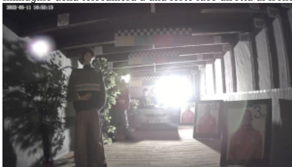
Immagine della telecamera a una forte luce diretta di fronte alla telecamera: