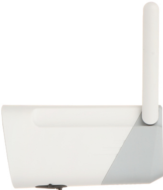
Vista dal basso: