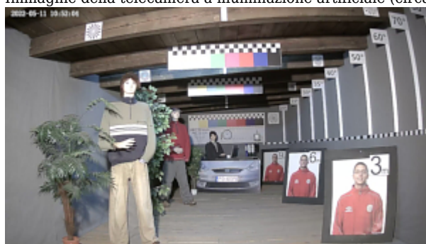
Immagine della telecamera di notte con illuminatore IR integrato attivato:

Immagine della telecamera a illuminazione artificiale (circa 30 Lux):